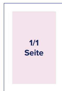
S.: 184 × 256 A.: 210 × 280