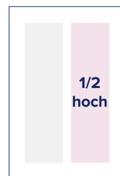
S.: 88 × 256 A.: 101 × 280