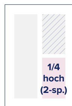
S.: 88 × 124

S. = Satzspiegel-Format A. = Angeschnittene Anzeigen Angaben in Millimetern (Breite × Höhe)