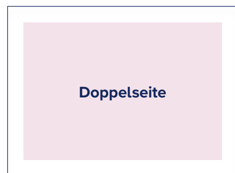
S.: 394 × 256 A.: 420 × 280