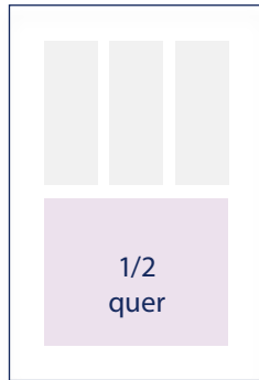
148 × 102 mm