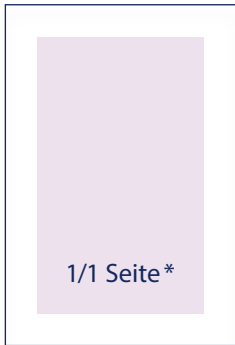
148 × 210 mm