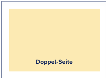
S.: 316 × 186 A.: 340 × 225