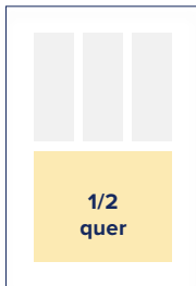
S.: 148 × 89 A.: 170 × 109