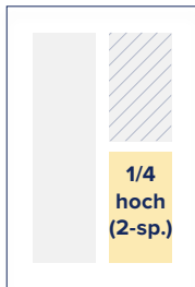
S.: 69 × 89