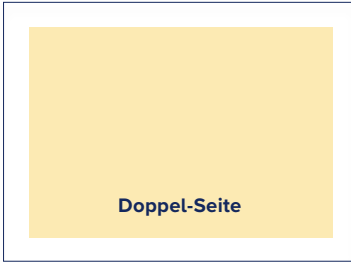
S.: 316 × 186 A.: 340 × 225