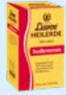
Luvos HEILERDE Sodbbrennen PZN: 18360733

Bei den beispielhaft aufgeführten Produkten handelt es sich um verkaufstarke Präparate, wie sie im typischen Sortiment der Apotheke vorkommen. Die Übersicht ist ein Service des Vertriebs des Wort&Bild Verlags. Sie hat keinen Empfehlungscharakter.