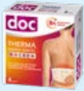
doc® THERMA WÄRME-GÜRTEL RÜCKEN PZN: 18017142