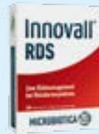
Innovall® RDS PZN: 12428051