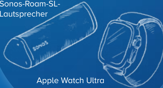
Apple Watch Ultra