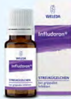
Infludoron PZN: 09647424