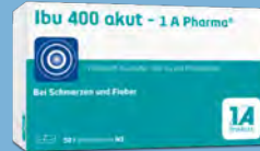
Ibu 400 akut - 1 A Pharma PZN: 03045316