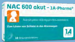
NAC 600 akut - 1 A Pharma PZN: 00562755