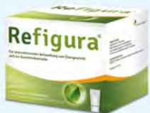
Refigura Sticks/Kapseln PZN: 12450240/13861123