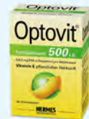
Optovit fortissimum 500 PZN: 006649629