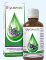
Glycowohl PZN: 13749314