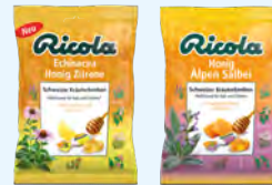
Ricola PZN: 14226009/12481619