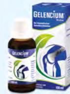
GELENCIUM PZN: 13234892