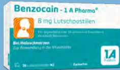
Benzocain - 1 A Pharma PZN: 12527043