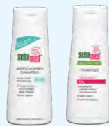
sebamed SHAMPOO ANTISCHUPPEN/UREA AKUT PZN: 11158135/06122939