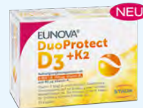
EUNOVA DuoProtect D3+K2 PZN: 14133532